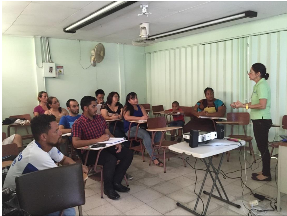
Capacitación a estudiantes de Siquirres en temas de la Defensoría en el 2015.